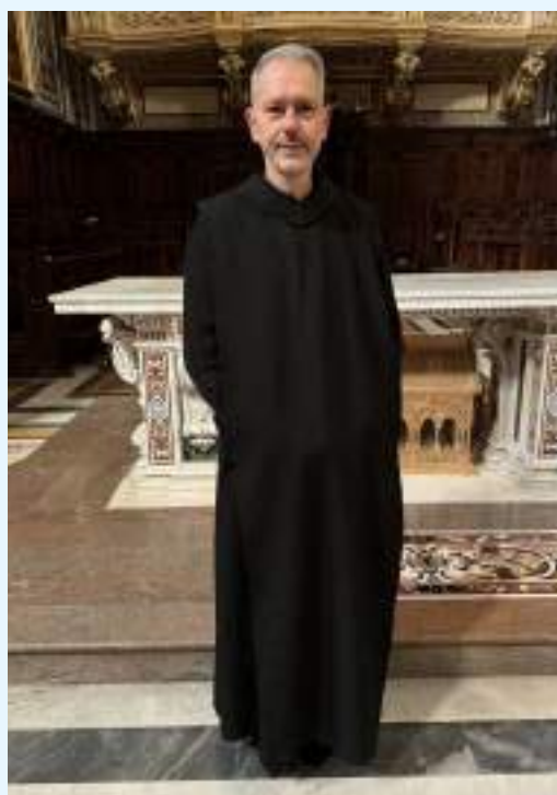
L'Abbazia accoglie il nuovo confratello

In occasione del IX centenario della morte di San Pietro Pappacarbone (1123 - 4 marzo - 2023), Vescovo di Policastro e Abate III dell'Abbazia di Cava, Patrono della diocesi di Teggiano Policastro, l'Urna contenente le reliquie del Santo Vescovo e Abate è stata trasferita dal 26 febbraio al 5 marzo, per esporla alla pubblica venerazione dei fedeli nella Concattedrale di Policastro Bussentino, le reliquie di San Pietro