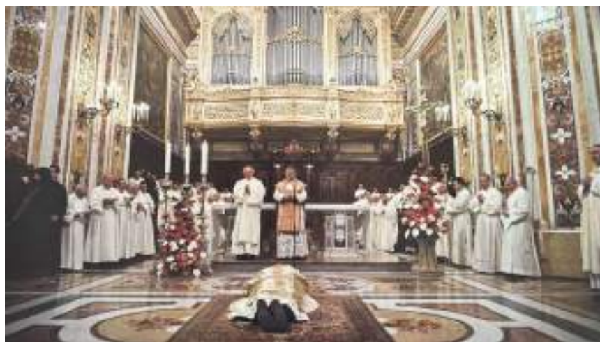
Momento della prostrazione durante il rito abbaziale.