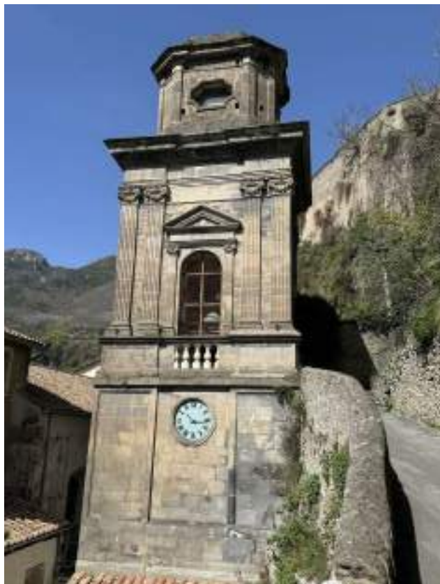
Campanile della Badia con l'orologio

Il monaco è consapevole di aver ricevuto grandi tesori da amministrare, talenti da gestire ed è votato, giorno e notte, a questa causa. Egli