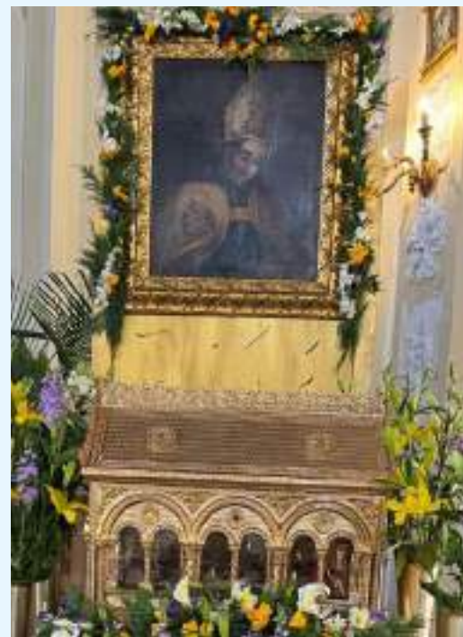
L'urna e il dipinto di san Pietro Vescovo e Abate nel Duomo di Policastro