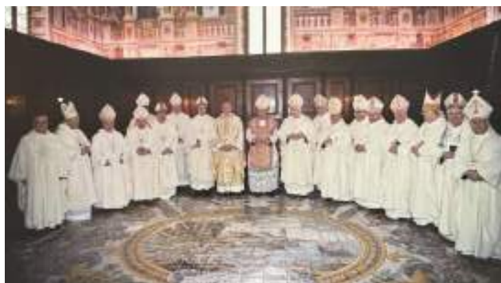
La partecipazione dei Vescovi della Campania e degli Abati benedettini.

Sappia l'abate – dice Benedetto – che non deve essere agitato, inquieto; non eccessivo e ostinato; non geloso o sospettoso, altrimenti non avrà mai pace. Anche nell'impartire ordini sia prudente, previdente e riflessivo: deve usare discrezione e misura. San Filippo Neri, diceva: «si obbedisce molto a