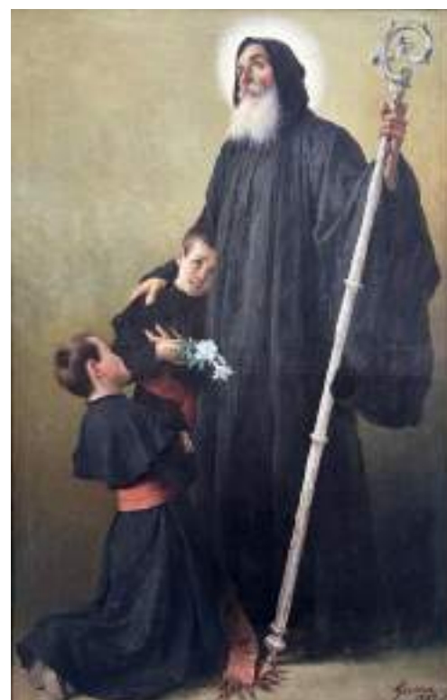
S. Benedetto con i santi Mauro e Placido Tela di Achille Guerra, 1887