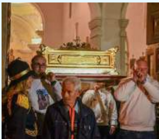
L'urna di san Costabile in processione a Castellabate