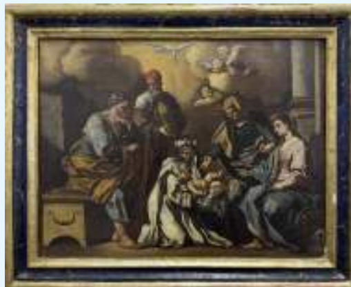
Sacra Famiglia con Santa Rosa