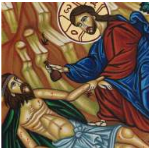
Gesù Buon Samaritano

E ciò ci rimanda alla nozione di responsabilità nella sua etimologia latina di rispondere, nel significato cioè che io medico sono responsabile di te ammalato nei confronti della tua stessa per-