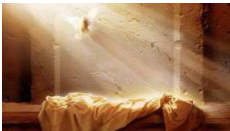
Le donne si recarono al Sepolcro e lo trovarono vuoto.

dei, Tu sei il bene, tutto il bene, il sommo bene, Signore Dio vivo e vero. Tu sei amore e carità, Tu sei sapienza, Tu sei umiltà, Tu sei pazienza, Tu sei bellezza, Tu sei sicurezza, Tu sei la pace. Tu sei gioia e letizia, Tu sei la nostra speranza, Tu sei giustizia. Tu sei temperanza. Tu sei tutto, tu sei ogni nostra ricchezza. Tu sei umiltà, Tu sei mitezza. Tu sei il protettore, Tu sei custode e nostro difensore, Tu sei forza, Tu sei rifugio...» (Lodi al Dio Altissimo). Celebrare la santa Pasqua significa stare lontano dall'idolatria insidiosa e credere nel vero Dio, aprire lo sguardo alla speranza riconoscendo che la storia è abitata dalla promessa e della presenza di Dio nelle piccole cose, nei segni umili quotidiani.